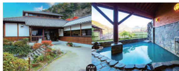
MAP 18 国見温泉 あかねの郷 国見町赤根2064-3 / tel:0978-82-1571 www.oct-net.ne.jp/infbairen/akane

山と海に囲まれた国東は、宿からも絶景を楽しむことができる。「あかねの郷」では千燈岳を眺めながら天然温泉が満喫でき、「ホテルベイグランド国東」では展望大浴場から瀬戸内海を望める。