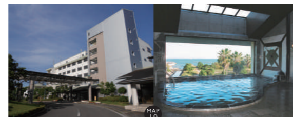
MAP 19 ホテルベイグランド国東 国東町小原4005 / tel:0978-72-4111 www.hotel-baygrand.com

国見町から国道213号を海沿いに走ると趣きのある数寄屋造の建物が見えてきた。ここが本日の宿「海喜荘」のようだ。夫がいつこんなセンスのいい宿を予約したのか気にはなったが、その雰囲気の良いことに気づかずに不問にした。美しく手入れされた中庭と海を眺める天然温泉の存在に期待感は最高潮に。ゆっくりとした時間が純和風の部屋に流れ、二人だけでも飽きないものだと思いつける。国東の幸をふんだんに使った夕食と国東の地酒「西の関」に舌鼓を打ち、贅沢過ぎる1日を締めくくった。明日はどんな国東を見られるのか、期待に胸が弾む。